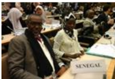
Délégation du Sénégal