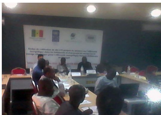
Participants atelier de validation des normes

En collaboration avec le projet PNEEB/Typha l'ASN le SCT efficacité Energétique a adopté dix (10) normes dans le domaine de l'efficacité énergétique dans les bâtiments et une norme sur le zonage climatique pour l'efficacité énergétique dans les bâtiments au Sénégal dans le domaine de l'efficacité énergétique dans les bâtiments lesquelles normes ont été homologuées par Conseil Administration.