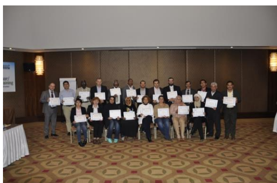
Experts Participants à l'atelier