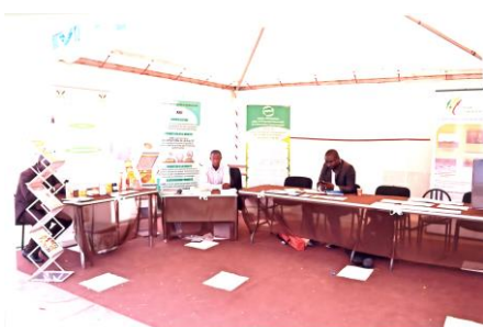
Stand MIM journées CNES à Thiès