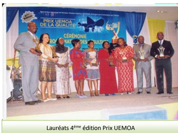
Lauréats 4 ème édition Prix UEMOA

La remise de la 4e édition du Prix UEMOA de la Qualité s'est passée le mardi 10 février 2015 sous la présidence de Monsieur Cheikh Hadjibou SOUMARE, Président de la Commission de l'Union économique et monétaire ouest-africaine (UEMOA) à Ouagadougou - Burkina Faso.